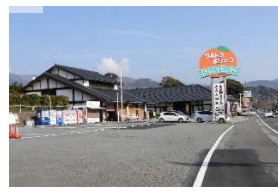
伊豆オレンジセンター