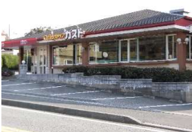
ガスト(レストラン)